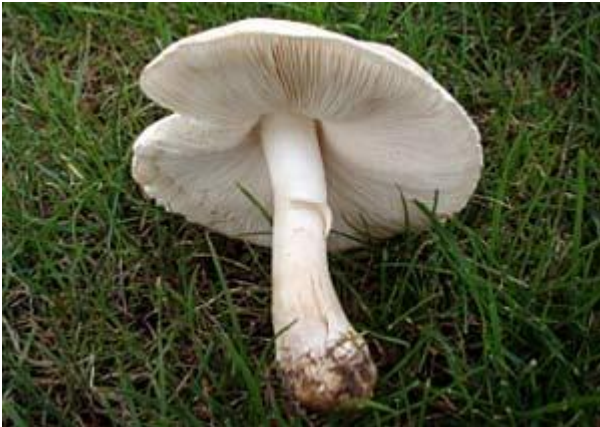
Weißer Knollenblätterpilz ( Amanita virosa )

Zu den häufigsten und bekanntesten Pilzen im Rasen gehört der Feldegerling oder Wiesenchampignon ( Agaricus campestris ). Er hat keinen Einfluss auf das Gräserwachstum. Der schmackhafte Pilz hat einen weißen Hut unter dem sich zunächst rosafarbene und im älteren Zustand dunkel schokobraune Lamellen befinden.